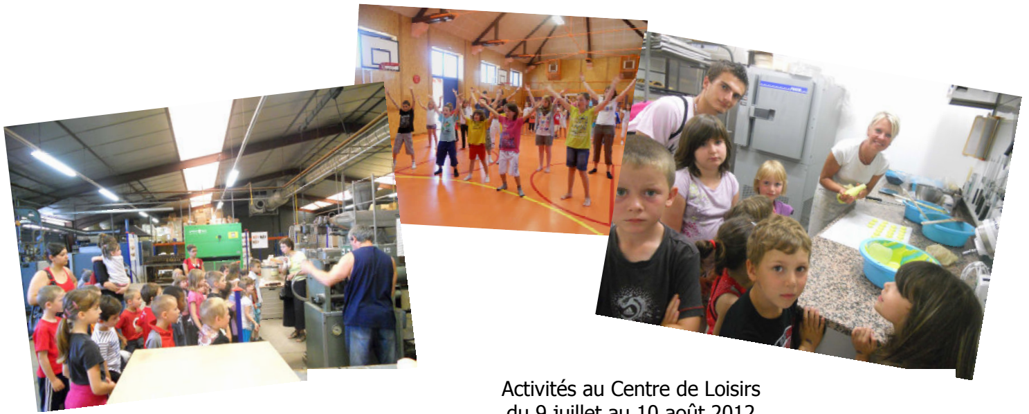
Activités au Centre de Loisirs du 9 juillet au 10 août 2012