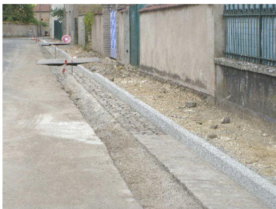
Réfection du trottoir rue Remoiville