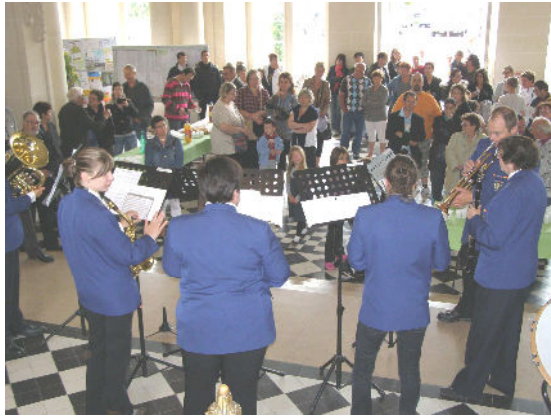
Fête des Mères 3 juin 2012