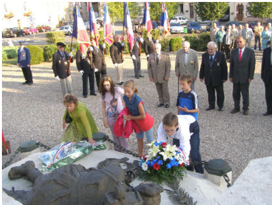
Cérémonie Libération ETAIN 1 er septembre 2012