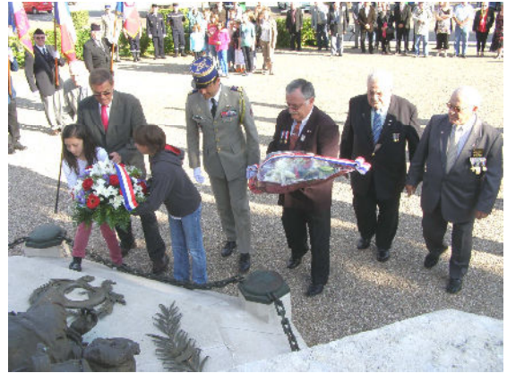
Cérémonie du 18 juin 2012