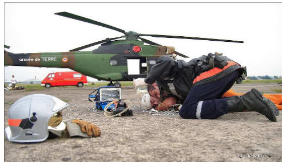
Plan rouge au 3 ème RHC, l'entraînement nécessaire

Elle participe au soutien et à l'assistance de la population, à l'appui logistique et au rétablissement des activités en cas de sinistres. Elle contribue également à l'information et à la préparation de la population face aux risques encourus par la commune, en vue de promouvoir la culture locale et citoyenne sur les risques majeurs.