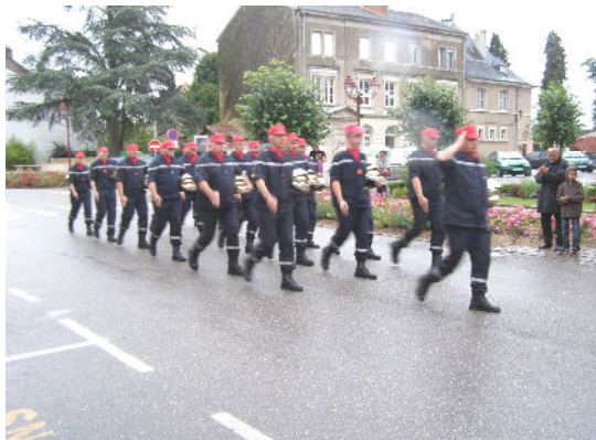
Défilé du 13 juillet 2012