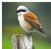
Pie grièche écorcheur mâle, 1 couple avec 3 jeunes présents sur la zone