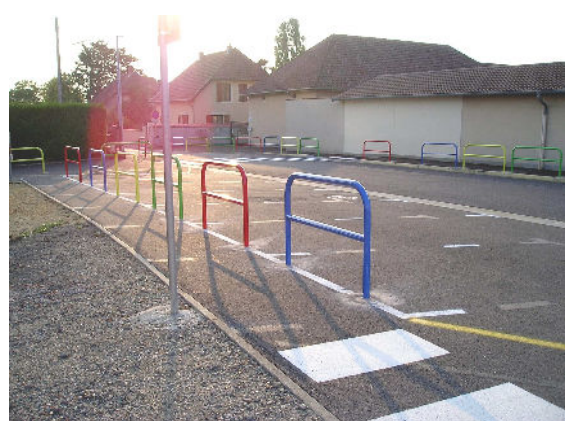
Amélioration de la sécurité rue des Ecoles