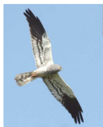
Busard cendré mâle