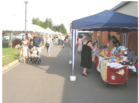
Marché du terroir 27 juillet 2012