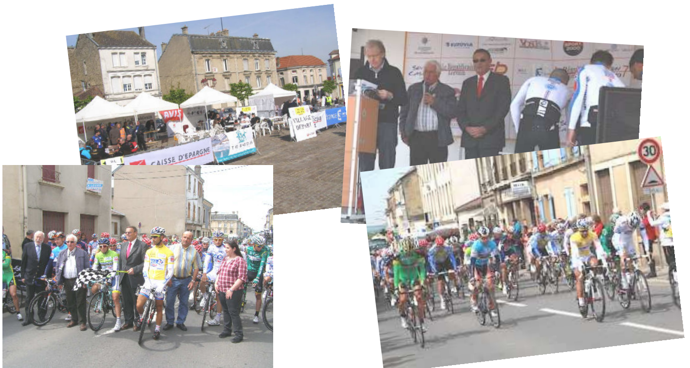
Circuit de Lorraine - ETAIN, ville départ 17 mai 2012