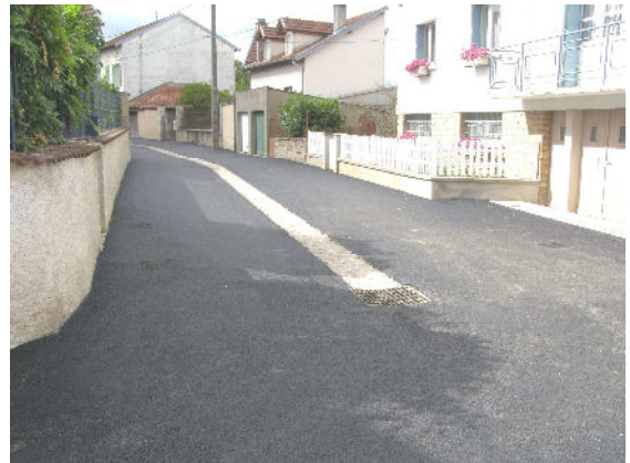
Travaux rue Leloup