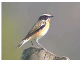
Tartier des prés mâle