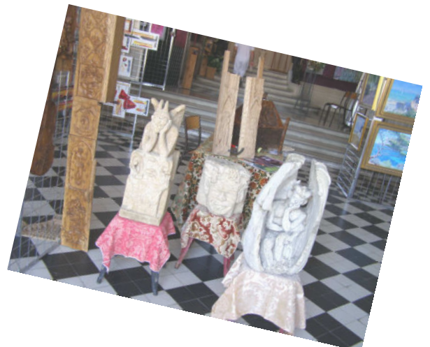
Exposition GAW - EHA 26/27 mai 2012