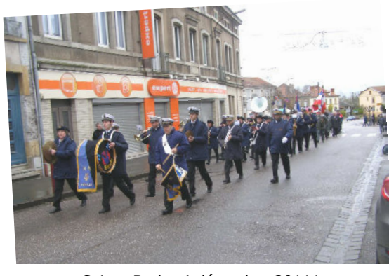
Sainte Barbe 4 décembre 2011