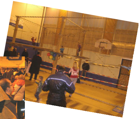
Téléthon et St Nicolas 3 décembre 2011