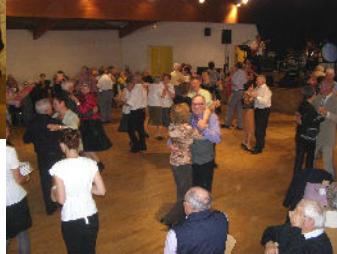
Repas des Aïnés du 9 octobre 2011