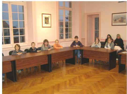
CMJ élection du Maire 7 novembre 2011