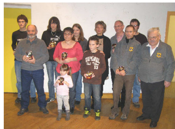
Remise des trophées aux sportifs 16 décembre 2011