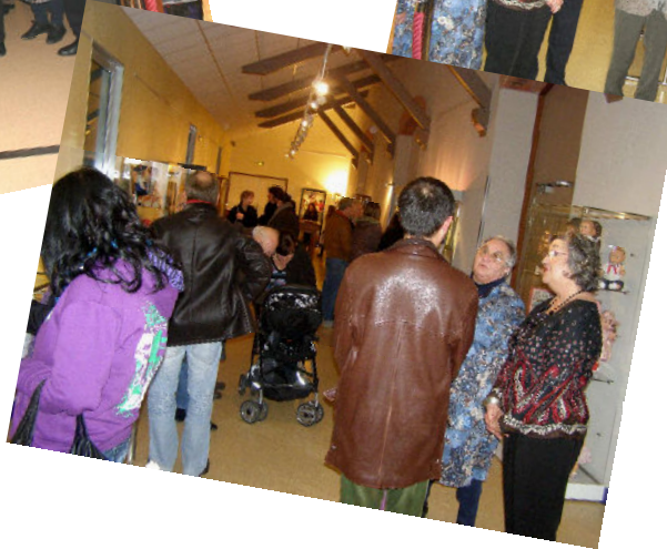
Salon de la poupée Petitcollin 27 novembre 2011