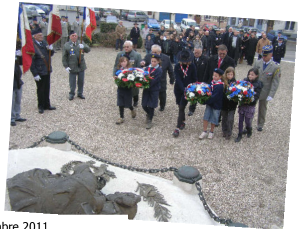
Cérémonie du 11 novembre 2011