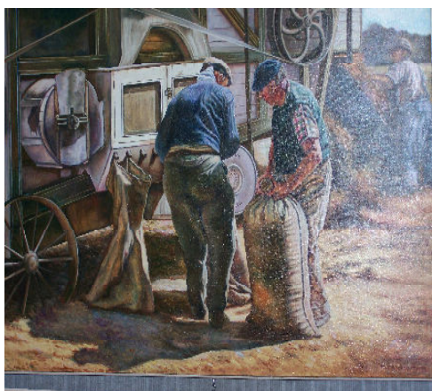
la batteuse : huile de Michel PRANZETTI

Adhésion : 10 euros à l'année Gratuit pour les jeunes jusqu'à 18 ans.