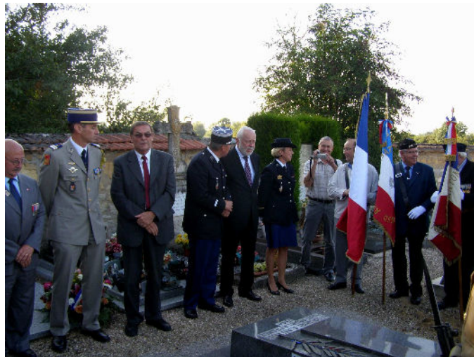
Libération d'Etain Mercredi 1er septembre 2010