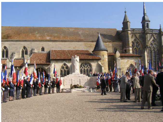
Congrès du Souvenir Français le 04.09.2010