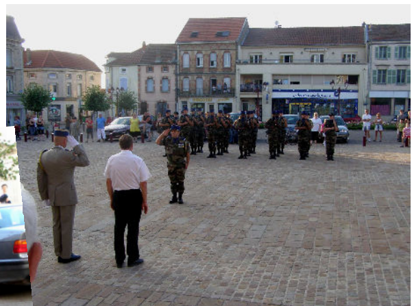
13 Juillet 2010 avec le 3° RHC et les pompiers