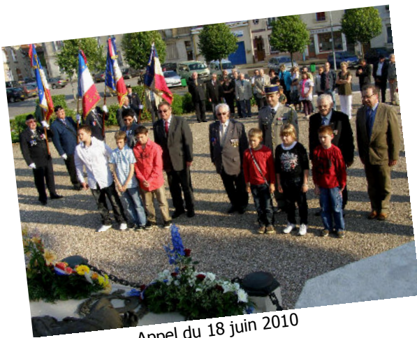
Appel du 18 juin 2010