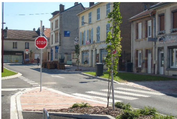
Pose des pavés, place des Fusillés Les travaux touchent à leur fin.