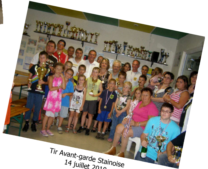
Tir Avant-garde Stainoise 14 juillet 2010