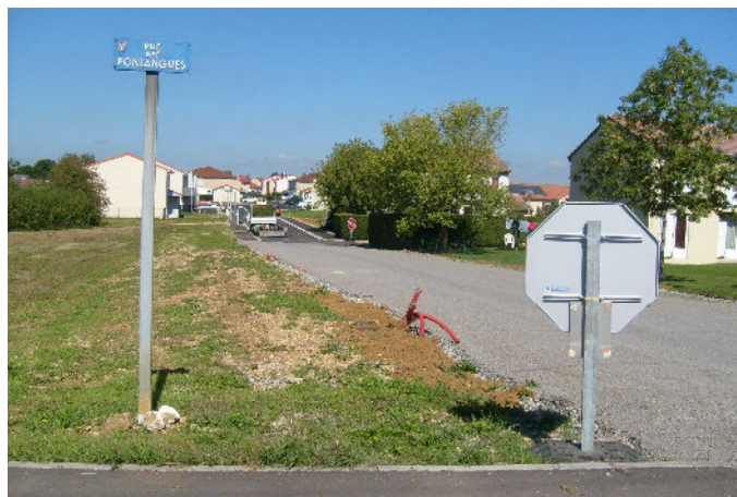
Prolongation de la rue François Villon permettant la jonction avec la rue des Fontanges