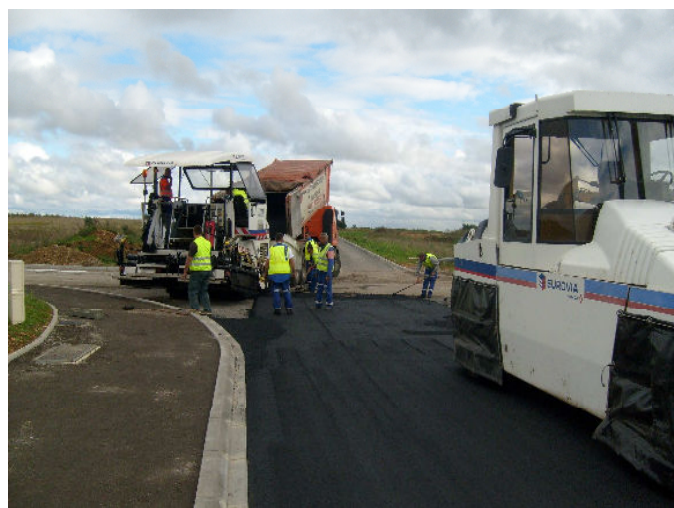
Pose des enrobés sur la voirie de la ZAC, le 8.09.2010