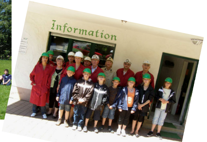
20ème anniversaire du Jumelage Samedi 5 juin 2010